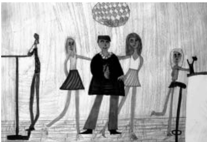
Szene aus dem Musical „Vita Semper“