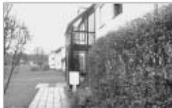
Isen 3 Zimmer

Schicke Wohnung mit Ausbaumöglichkeit. 3 Zimmer – ca. 83 m² Wohnfläche. Parkett-, Fliesen- und Korkböden. Bad mit Fenster. Einbauküche, großzügiger Wohn-Essbereich, 2 Südbalkone, Kellerabteil und Garage, allgem. Wasch- und Trockenraum. Frei nach Vereinbarung. Haus- und Nebenkosten 235,- €.