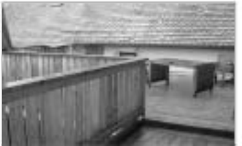
Isen Altbauwohnung - 3 Zimmer

Raiffeisen-Volksbank Isen-Sempt eG Immobilien-Service-Zentrum Erdinger Str. 8, 85457 Hörkofen Tel. 08122/892059-0 immo@rvb-isen-sempt.de