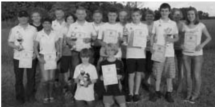
Die Eschbaumer Sommerbiathleten mit ihren Urkunden und Pokalen beim Burgrainer-Sommerbiathlon 2011.

Weitere Informationen insbesondere zu den Wettkampfbedingungen sind unter www.sg-eschbaum.de oder Tel. 08083/1771 zu erhalten.