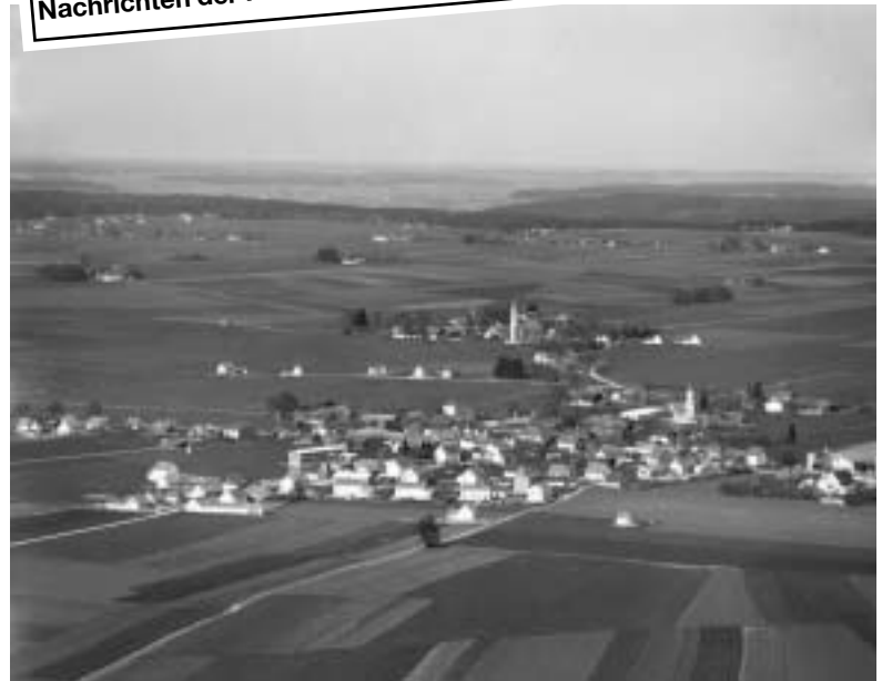
Forstern im Jahre 1950 ...

Das 19. Jahrhundert begann für Forstern „mit einem furchtbaren Paukenschlag“, berichtet der Chronist. Im Jahr 1800 wurde das Gemeindegebiet in die verhängnis-