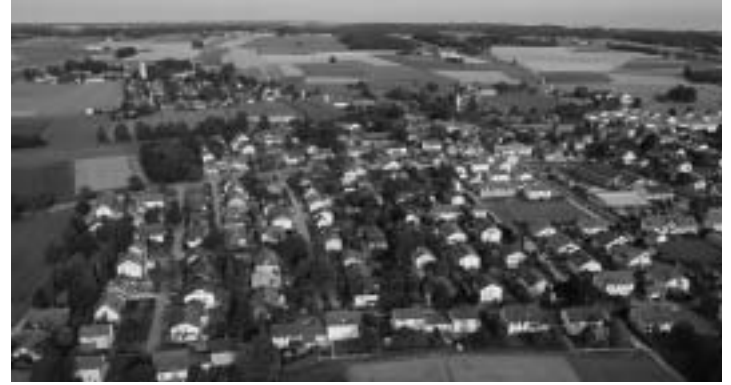
... und im Jahre 2010.

Handel, Handwerk und Gewerbe manchen Vorteil ziehen. Auf diese Weise wurden durch die Entwicklung der Firma Eicher bis in die 70er Jahre entscheidend auch die Geschichte der Gemeinde Forstern mitbestimmt.