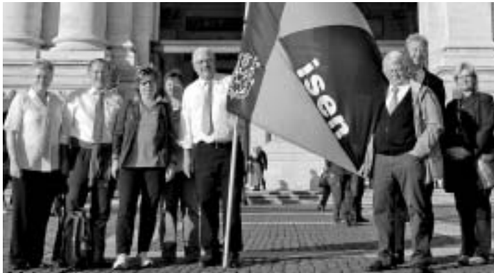
Einige der Isener Rom-Wallfahrer vor der Basilika San Giovanni in Laterano in Rom.