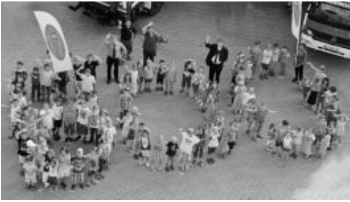
Forstern probt für die 800-Jahr-Feier.

ländischen Mitbürger in Forstern mitwirken werden ( www.forstern-feiert.de ).