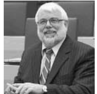
Kommt am 20. November nach Isen: Der Landtagsabgeordnete Martin Güll

Zum Frühschoppen mit dem Landtagsabgeordneten Martin Güll lädt die Isener SPD am Sonntag, 20. November um 10.00 Uhr im Gasthof Klement. Der bildungspolitische Sprecher der SPD-Landtagsfraktion wird ein Konzept vorstellen, das mehr Eigenverantwortung für die Schulen vorsieht. Für Güll steht fest: „Die Schulen hängen zu sehr am Gängelband des Kultusministeriums.“ Die SPD will den Gesetzentwurf dafür aber nicht allein ausarbeiten. Es sollen vor allem die beteiligt werden, die es betrifft: Schulleiter, Lehrer, Eltern und Schülervertreter. Kontakt: www.spd-isen.de