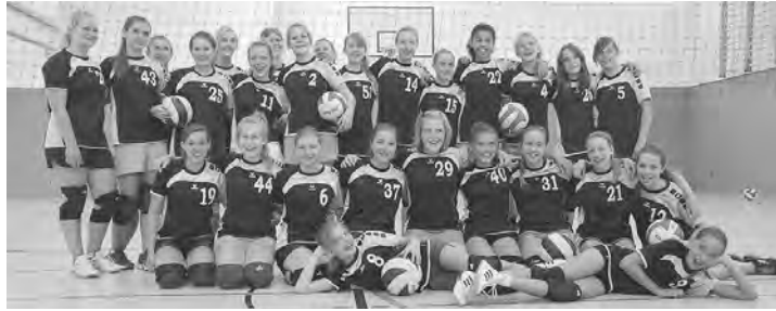
Die Volleyball-Mädchen im Trainingslager in Inzell (Juli 2013)

Das letzte Jahr war ein Gutes für die Abteilung Volleyball. Vor allem unsere Jugendmannschaften haben sich im Ligabetrieb etabliert: