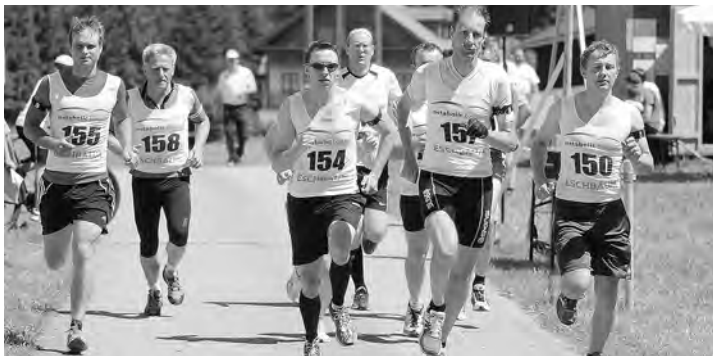
Am 21. 6. 2014 starten die Cross-Biathleten wieder in Zieglstadl.