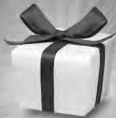
UPGRADE ZUR LUXUS-AUSSTATTUNG