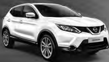
NISSAN QASHQAI ACENTA 1,2l DIG-T, 85 kW (115 PS)