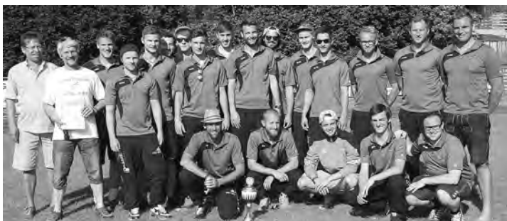
Die Fußballer des TSV Isen wurden Meister der A-Klasse und steigen in die Kreisklasse auf.