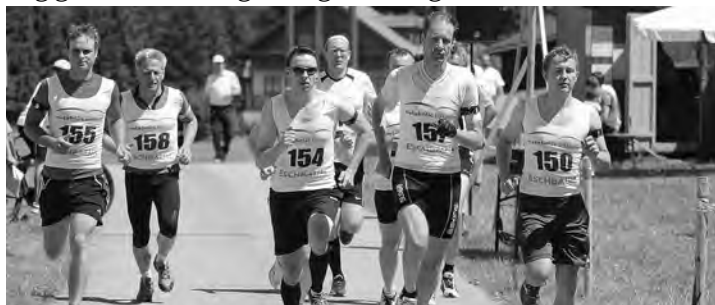
Am 20. 6. 2015 starten die Cross-Biathleten wieder in Zieglstadt.

Am 20. 6. 2015 ist es wieder soweit! In Zieglstadt bei Isen veranstaltet die Schützengesellschaft „Friedliches Tal“ Eschbaum ihren alljährlichen Cross-Biathlon. Auch der allseits beliebte Gaudi-Radbiathlon wird wieder ausgetragen. Ab 11 Uhr starten die Teilnehmer des Cross-Biathlons in den verschiedenen Wettkampfklassen. Anschließend – gegen 15 Uhr – wird ein Gaudi-Radbiathlon veranstaltet. Dabei kämpfen Teams aus drei Radfahrern und einem Schützen in einem lockeren Wettstreit um den Sieg. Wir laden alle Isener Bürgerinnen und Bürger ein, nach Zieglstadt zu kommen, um die Biathleten zu unterstützen. Für das leibliche Wohl ist ab Beginn der Wettkämpfe ganztägig u.a. mit Grillfleisch, Steckerlfisch sowie Kaffee und Kuchen bestens gesorgt. Auch nach den Wettkämpfen und der Siegerehrung gibt es ausreichend Gelegenheit, den Tag gemütlich und gesellig ausklingen zu lassen. Die Esch-