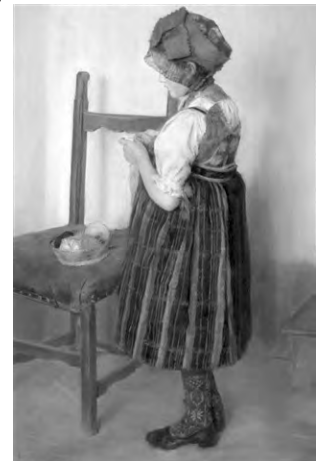
Strickendes Mädchen 1895

Das Bildnis wurde im Jahr 1894 in der Berliner Kunstausstellung unter Nummer 280 mit der Ergänzung „Alte Frau in Dachauer Tracht“ angeboten und gilt seit 1945 als verschollen. Ob eine Verbindung zum Bild der Kunsthalle Düsseldorf besteht, ist nicht zu rekonstruieren. Besondere Beachtung finden die beiden Pastelle auf Karton „Mädchen in Festtagstracht“ von 1894 im Format 100 x 70 cm und „Strickendes Mädchen“ von 1895 im Format 133 x 80 cm, das im Besitz eines Sammlers in der Schweiz ist. Im Heimatmuseum