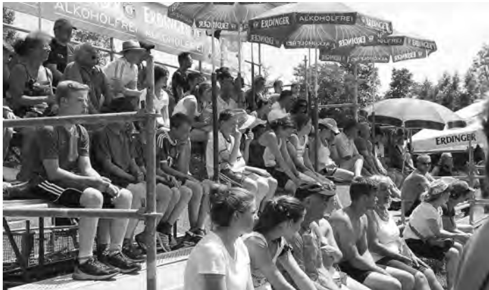
Die Zuschauer trotzten gut beschirmt der Rekordhitze beim Sommerbiathlon in Burgrain.