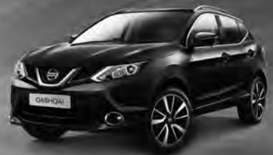
NISSAN QASHQAI TEKNA 1,2l DIG-T, 85 kW (115 PS)