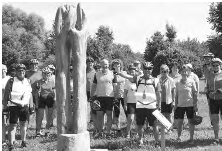
Auch die Isener Skulptur „Gemeinschaft“ wurde im Rahmen der SkulpTour2 vorgestellt.

Eine Verknüpfung von Radfahren und Kunst ist die Grundidee für den Radwanderweg „SkulpTour“, der in naher Zukunft alle Gemeinden des Landkreises verbinden soll. Die zweite Etappe „SkulpTour2“ wurde nun bei herrlichem Sommerwetter vorgestellt. Insgesamt 30 Radfahrer hatten sich eingefunden und wurden vom Tourenleiter des ADFC Erding Wolfgang Fritz angeführt. Der Start erfolgte