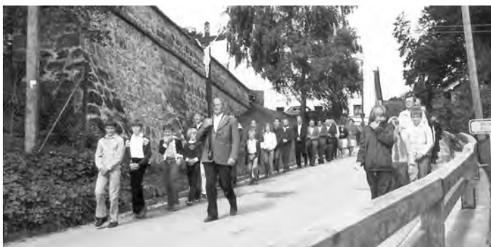
Bittgang nach St. Christoph im Jahr 1983