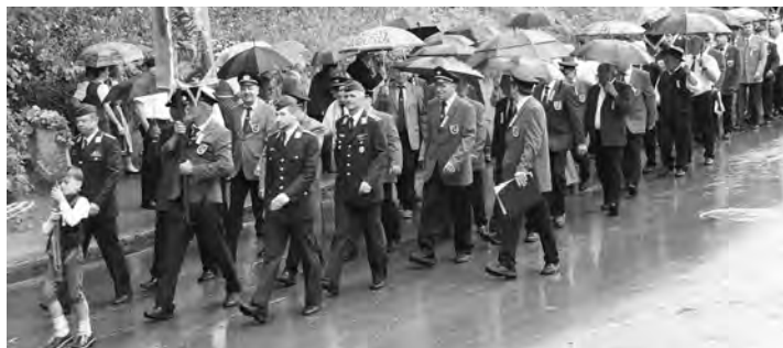
Drei Bundeswehresoldaten vom Fliegerhorst Erding marschierten in den Reihen der Veteranen- und Soldatenkameradschaft Isen mit.

Baumfällung jeder Schwierigkeitsgrad – Kürzen – Roden Abfuhr – Wurzelstockfräsen – Gartenpflege – Heckenschnitt Mäh- u. Mulcharbeiten – Brennholzverkauf – Holzspalterverleih Tel. 0172/5820173 od. 08122/1791661 Fa. Höllinger kostenlose und unverbindliche Beratung