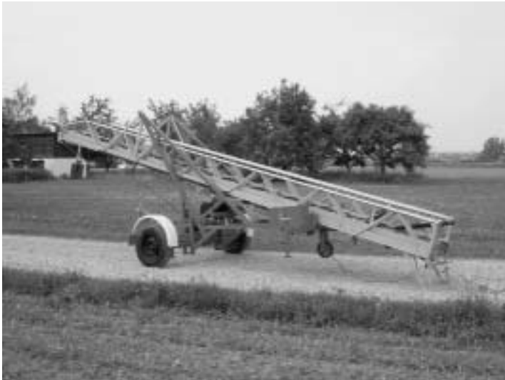
Die Anhängelleiter von 1988.

konnte also freistehend bis in eine Rettungshöhe von 16 Metern bei einer Ausladung von 4 Meter gearbeitet werden.