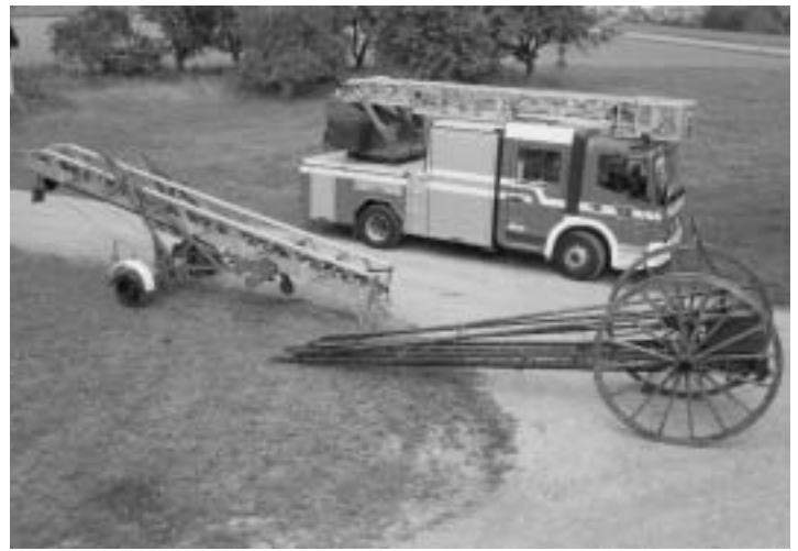
Die Leitern von 1896, 1988 und 2006.

Der Neupreis dieses 2 Jahre alten Vorführfahrzeug wäre deutlich über EUR 500.000 gelegen. Dank des Engage-