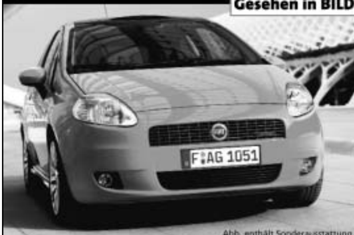
Abb. enthält Sonderausstattung.