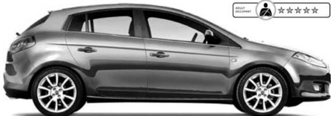
Abb. enthält Sonderausstattung.