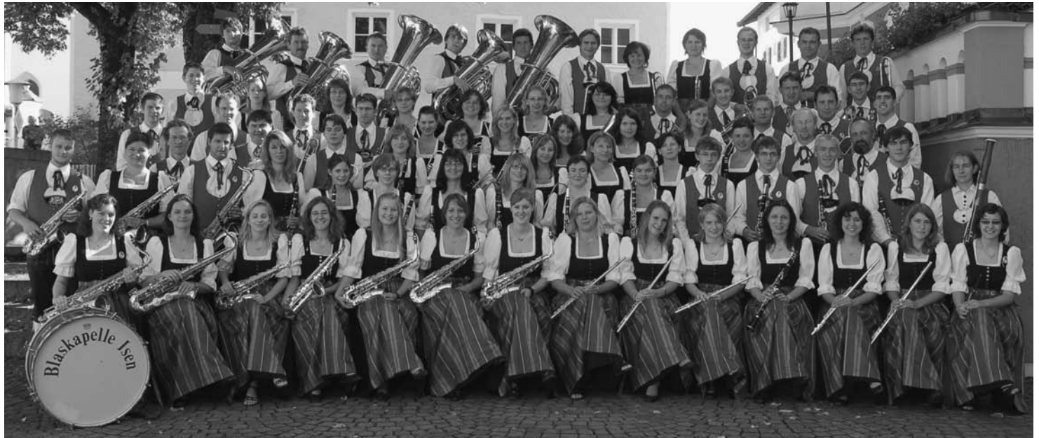
Die Blaskapelle im Jubiläumsjahr 2008

Zur 35-Jahr-Feier im Jahr 1993 wurde eine Festschrift erstellt und ein Jahr später entstand der erste „Blasmusik-Express“, die Vereinszeitschrift. Diese erscheint seither jährlich und dokumentiert alle nennenswerten Ereignisse um die Kapelle. Im Oktober 1995 wurde die Blaskapelle Isen Mitglied beim Kreisjugendring Erding. Seit 1994 finden im Sommer – vor allem in den Nachbargemeinden – Standkonzerte statt, um die musikalische Vielfalt der Kapelle auch außerhalb von Isen zu demonstrieren. Sicherlich mit ein Grund, weshalb seit 1996 die Frühjahrskonzerte aufgrund des großen Besucherandrangs an zwei Abenden in der Schulturnhalle stattfinden.