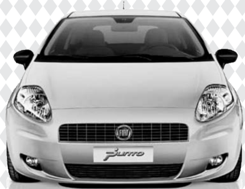
Abb. enthält Sonderausstattung.