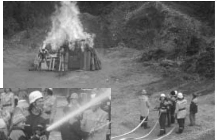
Schnuppertag bei der Jugendfeuerwehr Isen

Anfangszeit war jedoch nicht einfach. Mit vielen Aktionen, Infoständen und Veranstaltungen wie dem „Tag der offenen Tür“ versuchte man das Interesse der Kinder und Jugendlichen an der Feuerwehr zu wecken. Erleichtert wurde die Mitgliederwerbung dadurch, dass im Februar 1998 der Bayerische Gesetzgeber das Mindestalter für den Eintritt in die Jugendfeuerwehr auf 12 Jahre herabsetzte. Dadurch konnte nun bereits in jüngeren Jahren mit der Jugendarbeit begonnen und Jugendliche für die Feuerwehr begeistert werden. Neben der Faszination für die Feuerwehrentechnik und der Freude, durch sein Engagement anderen helfen zu können, sind es vor allem die vielfältigen Freizeitaktivitäten, die zu einem immer stärkeren Zulauf zur Jugendfeuerwehr Isen führten. So wurden Schnuppertage veranstaltet, an denen Holzhäuschen angezündet und dann professionell gelöscht wurden, mit anschließendem Lagerfeuer und Würstchengrillen. Auch die Teilnahme an Zeltlagern auf Landkreis- und Bezirksebene, Ausflüge und Hüttenwochenenden festigten den Zusammenhalt der Jugendfeuerwehr.