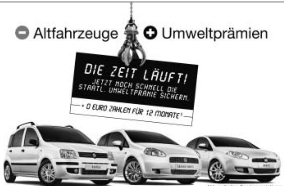
Abb. enthalten Sonderausstattung.