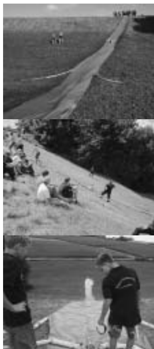
Wasserrutsche der Jugendfeuerwehr Isen

Nun war es an der Zeit, dass die Jugendfeuerwehr Isen eine eigene Fahne in Form eines Wimpels bekommt und in einem einheitlichen Outfit (Polo- und Sweatshirts) auftritt. Der Jugendfeuerwehr-Wimpel wurde nach den entsprechenden Richtlinien gestaltet und zeigt auf der blau eingefassten Rückseite das Logo der Jugendfeuerwehr Bayern auf weißem Grund. Auf die in den Farben des Marktes Isen in rot und gelb gehaltene Vorderseite wurde der Schriftzug „Jugendfeuerwehr Markt Isen“ sowie das Marktwappen gestickt. Der Jugendfeuerwehr-Wimpel sollte jedoch in einem angemessenen Rahmen seinen kirchlichen Segen erhalten. Daher setzten sich der Jugendwart Martin Kowalski und die Führung der Isener Feuerwehr dafür ein, dass das Kreisjugendfeuerwehrlager