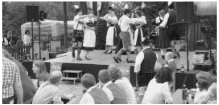
Auch der Isener Trachtenverein beteiligte sich an der Benefizveranstaltung „Isen musiziert“.