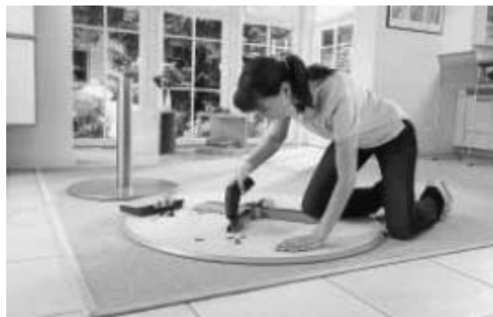
Trauen Sie sich! Jetzt anmelden für den RWG Frauen-Power-Abend.

Da die Plätze begrenzt sind, wird um eine Anmeldung bis spätestens 7. September 2009 persönlich im Markt, telefonisch oder unter info@rwg-erdinger-land.de gebeten.